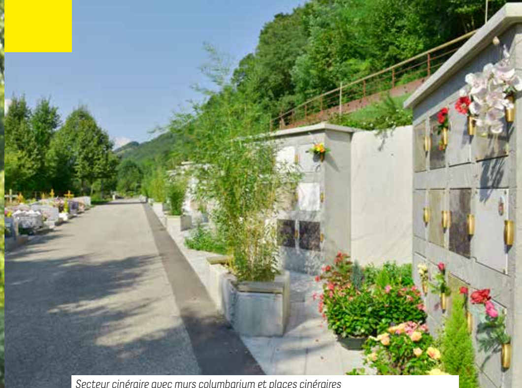
Secteur cinéraire avec murs columbarium et places cinéraires