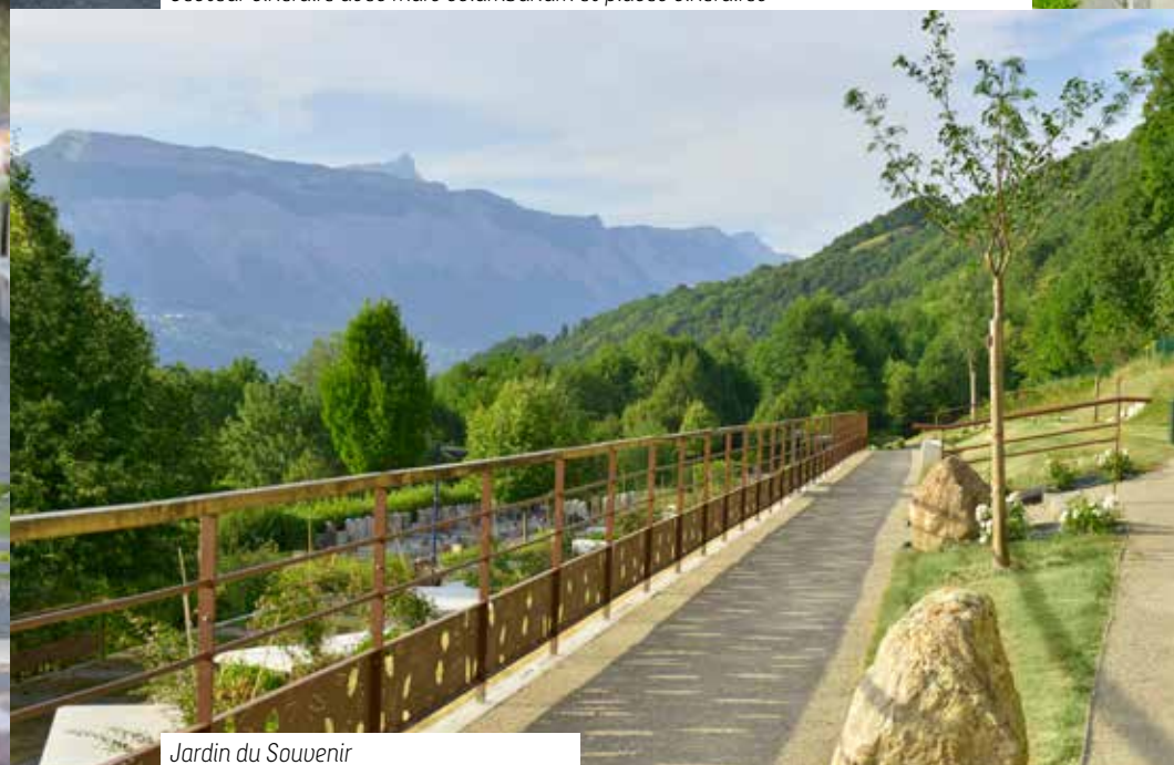
Jardin du Souvenir