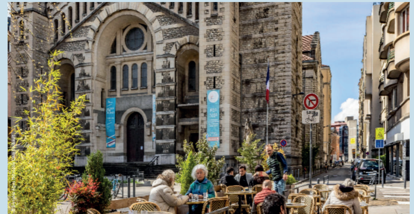
Les futurs aménagements renforceront un pôle commercial plus agréable, les échanges et la convivialité.