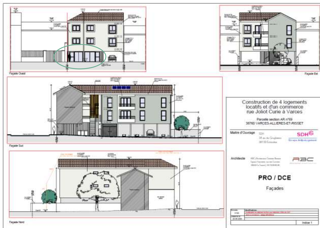
Figure 4: façade commerciale