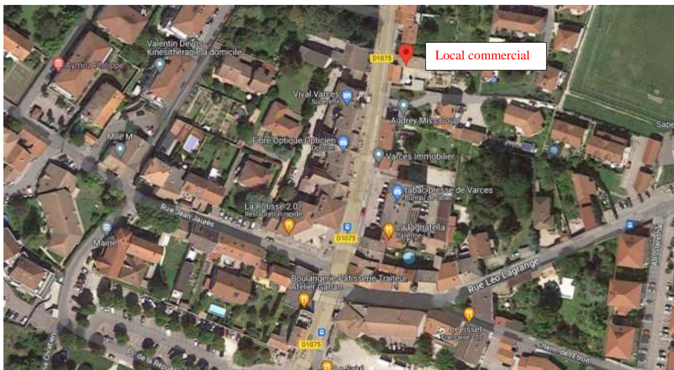
Figure 2: localisation du local commercial